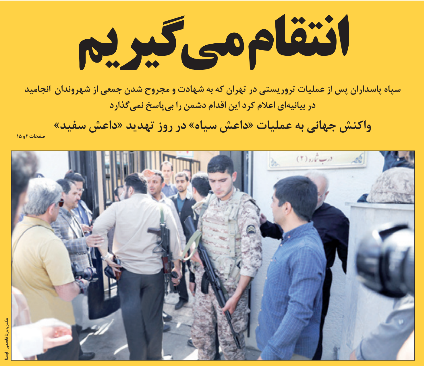
عکس بردارفتاسی اسسا

رهبر معظم انقلاب در دیدار دانشجویان با اشاره به حوادث تروریستی تهران: