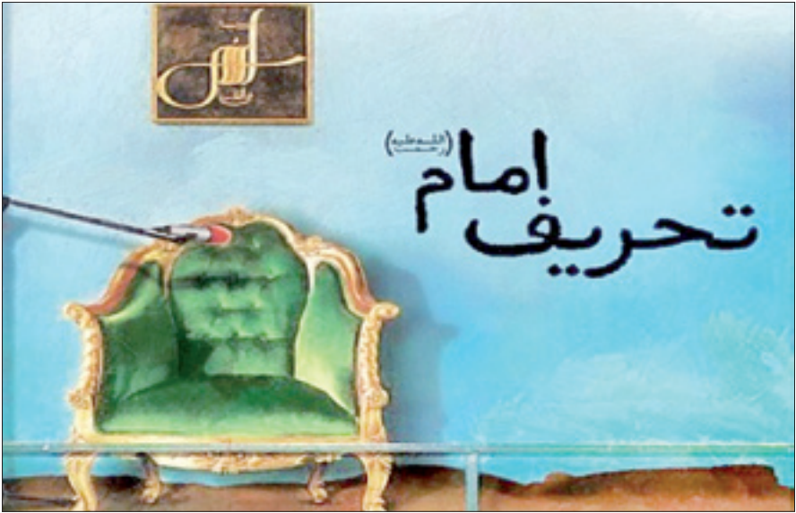
آیت‌الله العظمی آیت‌الله محمدتقی جعفری

در مقابل شعارهای انقلاب، عنوان و مفهوم عقلانیت را مطرح می‌کنند؛ کأنه عقلانیت نقطه مقابل انقلابیگری است، نه، این