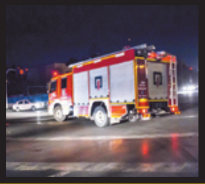
از نگاه آمار

رسانه‌ها و ساختارهای فرهنگی جامعه به شدت در پاره مصائب و پیامدهای استفاده از مواد مخترقه اطلاع‌رسانی کردند با این حال آنچه بر جای ماند چهار کشته و ۲ هزار و ۴۴۶ مصدوم بود که البته بسیاری از آمار به دلیل دور بودن از مراکز درمانی در این لیست ثبت نشده‌است.