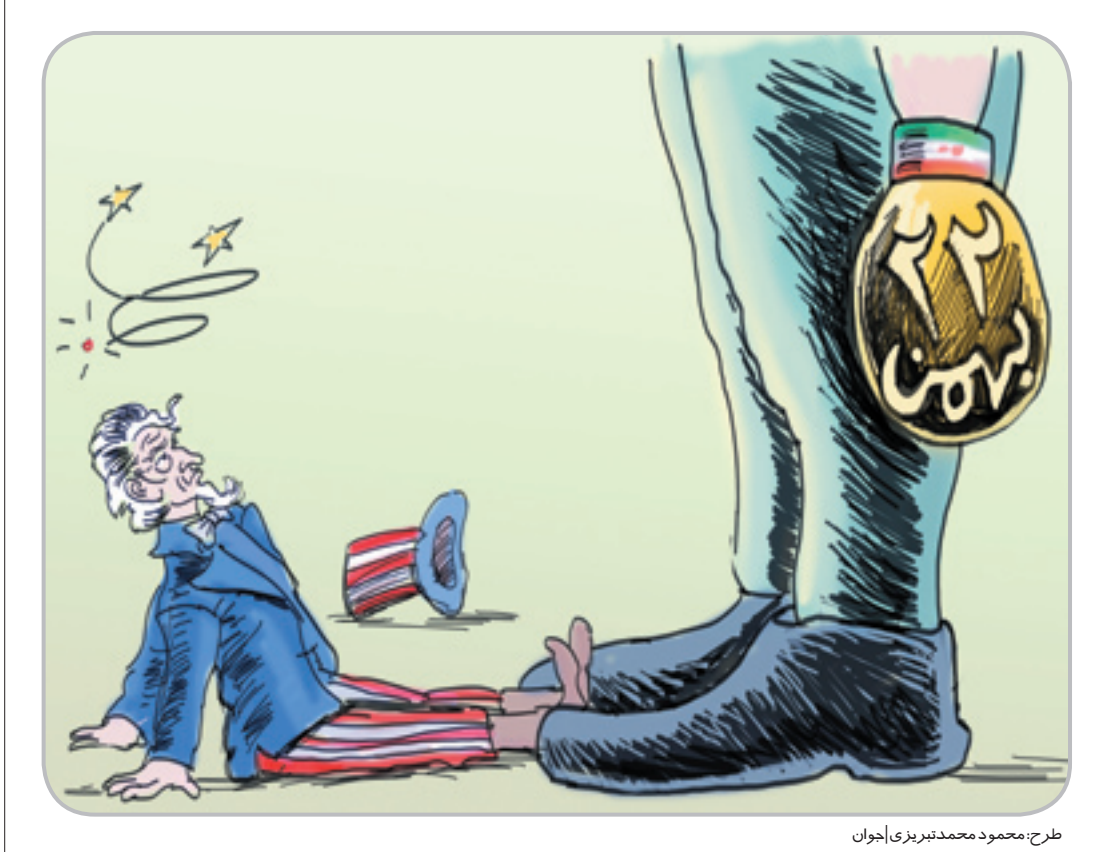
طرح: محمود محمدنیریزی | جوان