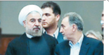
روحانی: که قول بدی بچه خوبی باشی دفعه بعد بهت نمره ۲۰ می دهیم! نحفی: که بگم برف مال دولت بهم ۲۰ می دی؟!

شهردار تهران: دولت در موضوع بحران برف به ما نمره ۱۸ داد این هم از عوارض برف رویی به دست دانش آموزان دولت شهرداری را با مدرسه اشتباه گرفته!