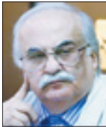
خسرو معتمد روزنامه‌نگار ومورخ

استفاده از خوردوی برقی منسوخ شد و منافع کمپانی‌های بزرگ نفت مانند استاندارد اویل کمپانی و بریتیش پترولیوم وشل وفرنس پترول (فرانسه) و کمپانی نفت دولتی هلند (مانافشه) و نفتی‌های روسیه افتضا کرد که سوخت فسیلی ترویج شود. در امتیاز تأسیس و واگن شهری به کمپانی بلژیکی حمل و نقل تهران که امتیاز قطار حضرت عبدالعظیم (ع) را هم گرفته بود، کمپانی در سال ۱۳۰۵ مق اواخر قرن نوزدهم تعهد کرده بود واگن الکتریکی در تهران بکشد که رشوه داد و زیر تعهد خود ز و سال‌ها ما گرفتار واگن مسخره تهران بودیم که در سال ۱۳۰۸ م ش۱۹۲۹ م آن را به زور دولت و بلده برچیدند. در روزنامه‌ای دیدم صفحه‌ای را به اتومبیل‌های هیریدی اختصاص داده‌اند و اینکه تویوتااز سال۱۳۷۶/۱۹۹۷ شروع به ساختن خودروهای هیبریدی کرده و ابتدا ۱۸ هزار دستگاه فروخته و هوندا وارد بازار امریکا شده و در سال ۲۰۰۹ فروش این خودروها به ۲ میلیون دستگاه رسیده است. یکی از بستگان من که در امریکا زندگی می‌کند، از فراید و آسانی راندگی با این خودرو تعریف‌های تلفنی زیادی می‌کند. محل زندگی این شخص با محل کارش دو ساعت فاصله دارد. اتومبیل خودکار است. احتیاج به بنزین ندارد. محیط را آلوده نمی‌کند. ۴۰ درصد اختلاف قیمت با خودروهای سوخت‌فسیلی دارد. به محض اینکه صحبت از ورود این خودروها به ایران شد، اولیای محترم دولت تعریف‌بالا برای آن تراشیدند و سخنگوی دولت اعلام کرد تعرفه واردات این خودرو از ۵ درصد به ۴۵ درصد افزایش می‌یابد که دولت بتواند حقوق‌های نجومی را بپردازد، همایش‌های پر هزینه را برگزار کند و به عزیزان و نورچشمان حقوق و مزایا برساند.