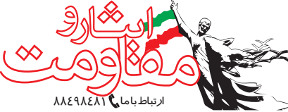
ارتباط با ما ۸۸۴۹۸۴۱

این ولید‌نام یکی از تپ‌های زرهی دشمن بود که در منطقه «کوت کاین» مستقر بود. این منطقه چهار ضلعی در پنج کیلومتری غرب کرخه قرار دارد که تپه‌های