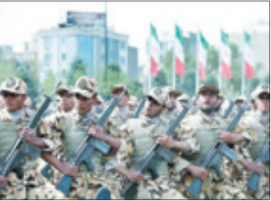
رئیس‌جمهور در مراسم روز ارتش: