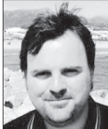
آدام بیت منتقد فوتبال اروپا

شکست ۱۰ بر ۲ در مجموع بازی، سنگین ترین شکست خانگی در ۱۹ سال اخیر و سنگین ترین شکست در خانه حالا هواداران آرسنال به نتایجی مثل بازی با رئال هم عادت کرده‌اند. بااین حال باخت سنگین به کپکشانای ها هنوز قبول کردند سخت است. هیچ تیمی از انگلیس تا به حال با چنین نتیجه‌ای از دور حذفی لیگ قهرمانان کنار نرفته است.سه سال پیش بود که ایوان قهرمانان حرف زد، اما آرسنال در هفت سال گذشته حتی یکبار هم موفق نشده‌از مرحله یک‌هشتم‌نهایی بالاتر برود.مشکل بزرگ ونگر در بازی بازیدیه می‌شد، بازیکنانی که انگار به جای زمین برای خودشان در هالیوود سیر و سفر می کردند.بااین وجود ونگر تصمیم گرفت بعد از بازی روی نحوه قضاوت داوړ متمرکز شود و دلیل اصلی شکست تیمش از اتریش لووان کوشیلی و پناالتی ای که به همراه داشت بداند. درست است که هواداران آرسنال هم این تصمیم داوړ را هو کردند و حداقل در این زمینه با ونگر هم رأی بودند، اما دفاع‌های همیشگی مربی شان از بازیکنانش، با استفاده از کلماتی مثل غرور، روحیه،و تعهد،اصلا برایشان قابل قبول نبود.باقی تیم‌ها