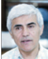
دکترمحمد خیبری نایبرئیس سابق فدراسیون فوتبال