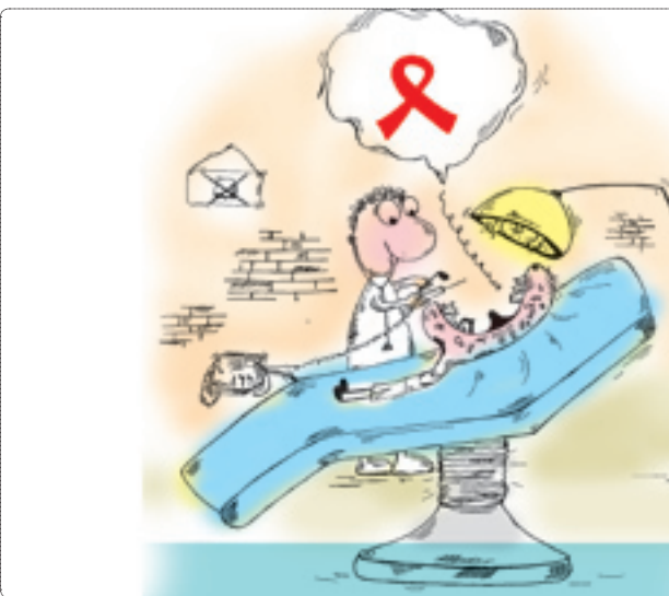
شرح: راضیه امامعلی/جوان

با تهیه طرح جامع و تفصیلی امیدوار بودیم از شهر فروشی فاصله بگیریم، تصریح کرد: متأسفانه در حال حاضر این اراده و تصمیم در شهرداری وجود ندارد و نگاه مدیران شهرداری رسیدن به سقف درآمد به هر طریق ممکن است. شکیب ادامه داد: شکیب در ادامه افزود: در حال حاضر ضوابط شهرداری در شهر برای کسب درآمد به راحتی به فروش می‌رسد، طبقات اضافی با تماس‌های تلفنی و اگذار می‌شود. باغ‌ها برای کسب درآمد بیشتر به غیر باغ تبدیل می‌شوند و همچنین واحدهای تجاری و اداری در محل‌های مسکونی به وفور و خارج از ضوابط و اگذار می‌شوند. وی با بیان اینکه